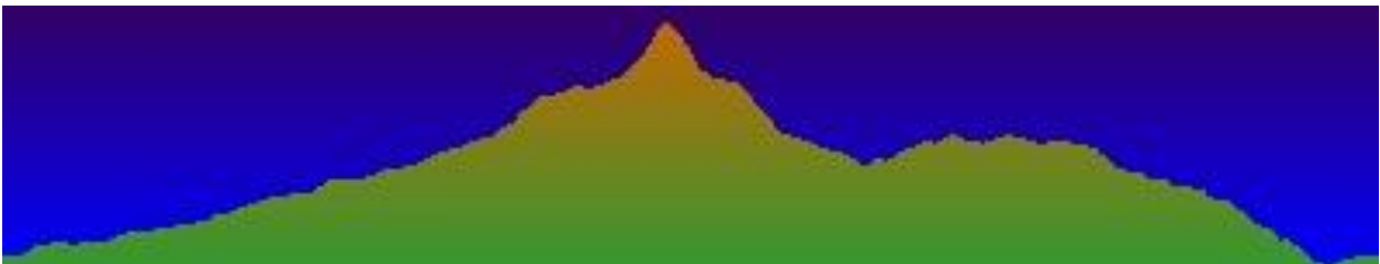
Perfil de la Ruta al Rocigalgo

Las pedrizas destacan particularmente en las sierras y en el paisaje en general, puesto que la vegetación ha encontrado dificultades para instalarse en algunas partes de estos canchales.